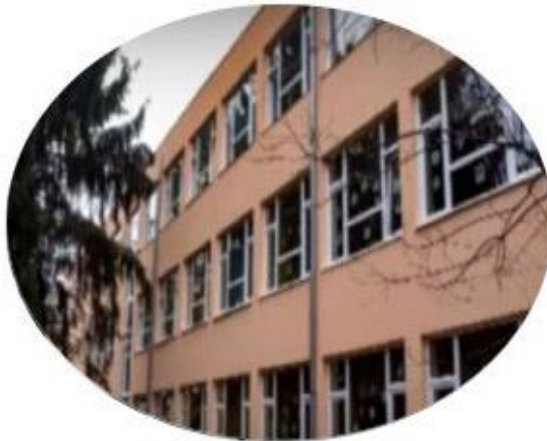
Hevesi Körzeti Általános Iskola és Alapfokú Művészeti Iskola