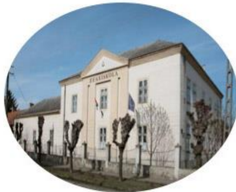
Hevesi Körzeti Általános Iskola és AMI Zeneművészeti Tagintézménye