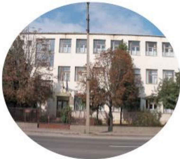
Hevesi Körzeti Általános Iskola és AMI Hevesi József Tagiskolája